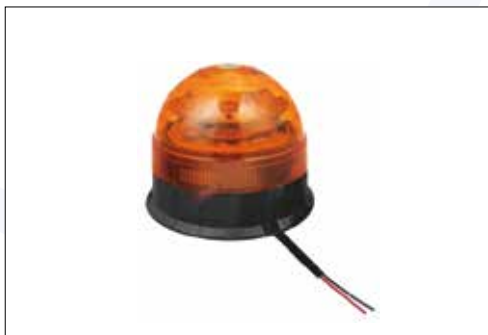
70 069068 Girofaro a LED, 12/24V, base magnetica, arancio, Ø140 x 130 mm Flashing LED light 12/24V, magnetic base, orange, Ø140 x 130 mm