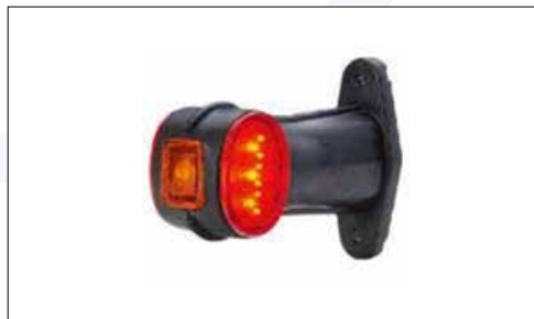
70 069170H Luce di ingombro a led DX/SX con cavo e supporto corto 7 Led end outline Marker Lamp with cable and short rubber support