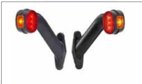
Luce di ingombro 7 led con cavo 7 Led end outline Marker Lamp with cable