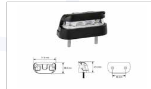
70 069162 Fanale targa a Led 12/24 V con click-in Led license lamp 12/24 V