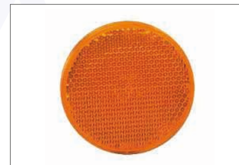
70 069049 Catadiottri adesivo arancio Ø 60