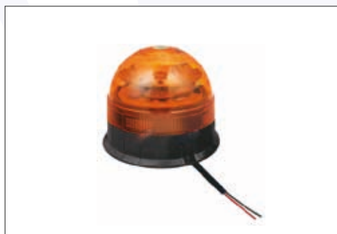
70 069068 Girofaro a LED, 12/24V, base magnetica, arancio, Ø140 x 130 mm Flashing LED light 12/24V, magnetic base, orange, Ø140 x 130 mm

Fino ad esaurimento scorte Until stock lasts