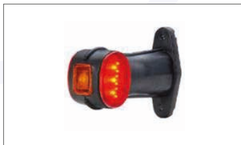
70 069170H Luce di ingombro a led DX/SX con cavo e supporto corto 7 Led end outline Marker Lamp with cable and short rubber support