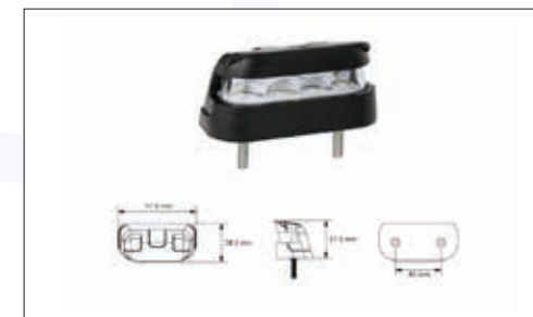
70 069162 Fanale targa a Led 12/24 V con click-in Led license lamp 12/24 V