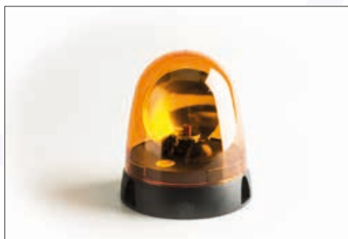
70 069052 Girofaro 12/24V, arancio, Ø142 x 183 mm Flashing light 12/24V, orange, Ø142 x 183 mm

Fino ad esaurimento scorte Until stock lasts