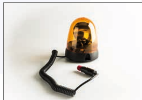
70 069055 Girofaro 12/24V, base magnetica, arancio, Ø142 x 198 mm Flashing light 12/24V, magnetic base, orange, Ø142 x 198 mm