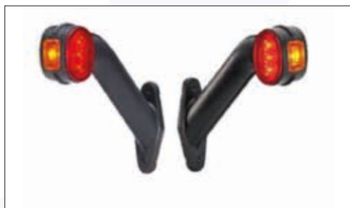
Luce di ingombro 7 led con cavo 7 Led end outline Marker Lamp with cable